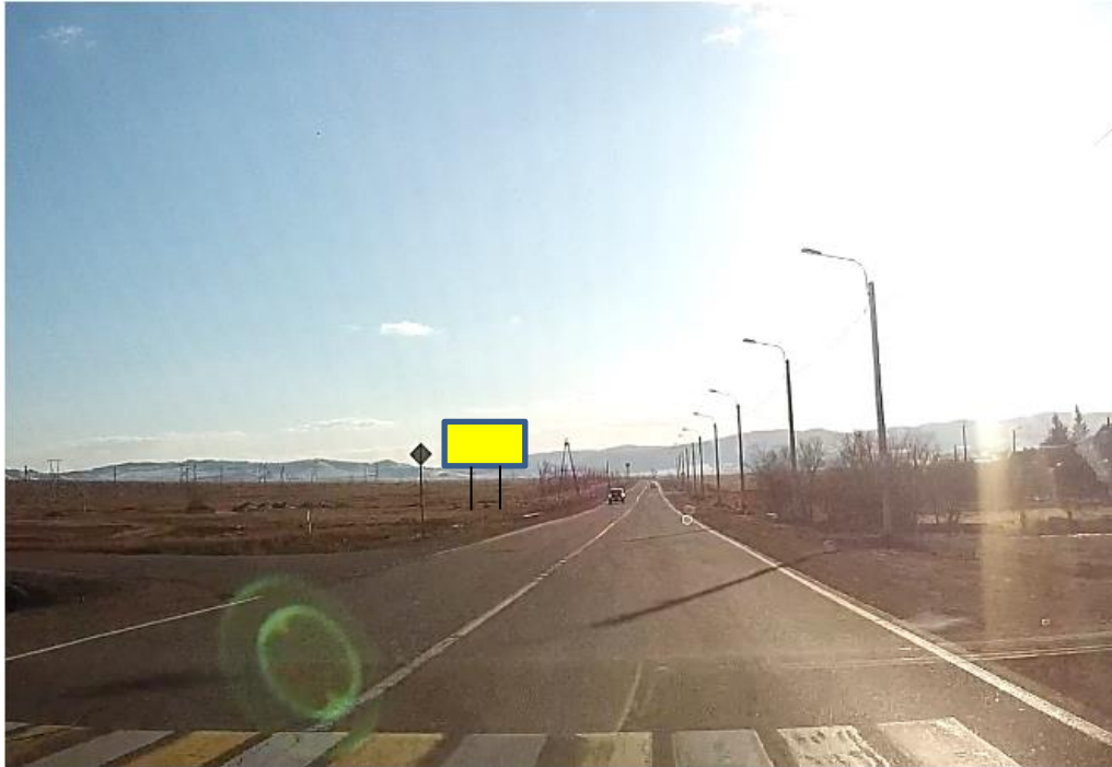
Фотография Сторона А (по ходу движения)