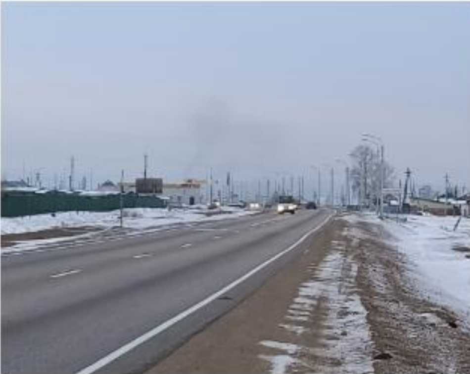
Фотография Сторона А (по ходу движения)