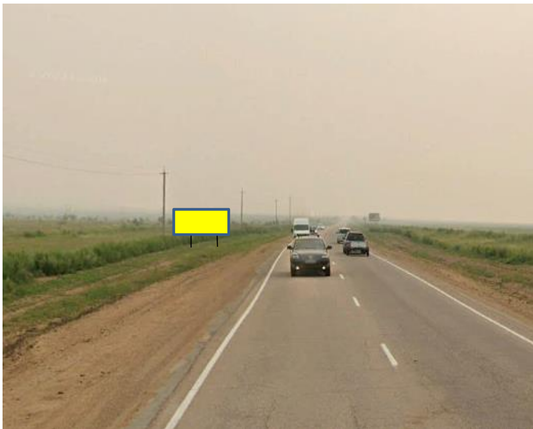
Фотография Сторона А (по ходу движения)