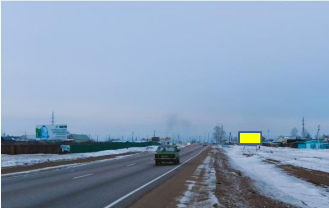
Фотография Сторона А (по ходу движения)