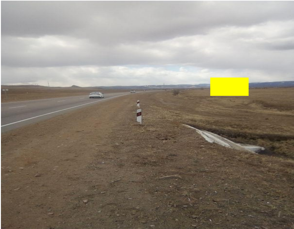
Фотография Сторона А (по ходу движения)