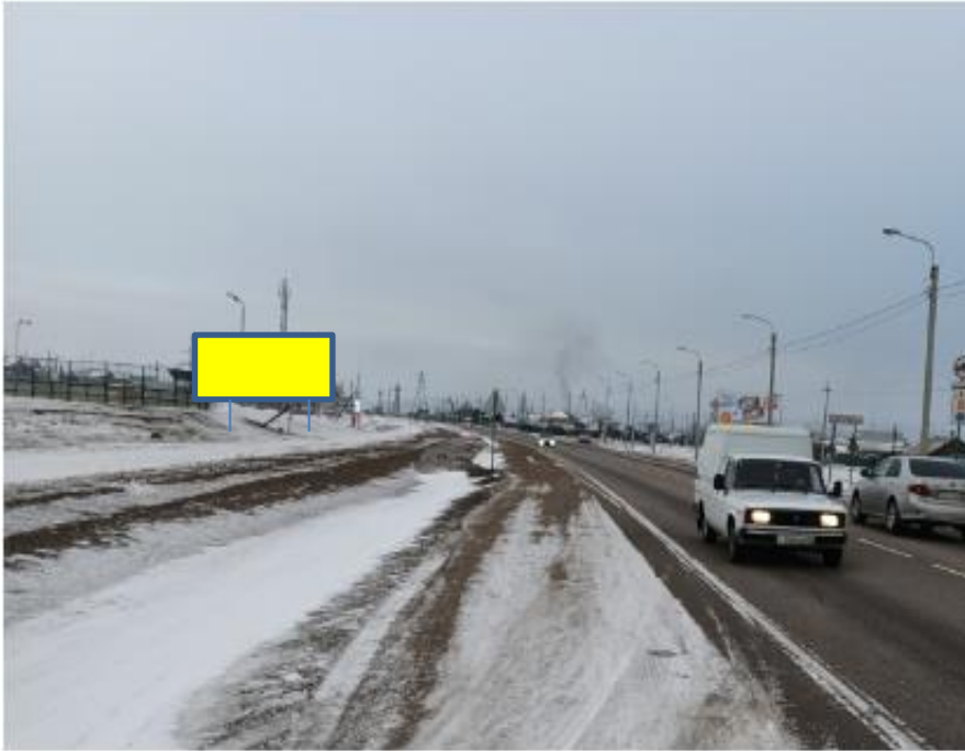
Фотография Сторона А (по ходу движения)