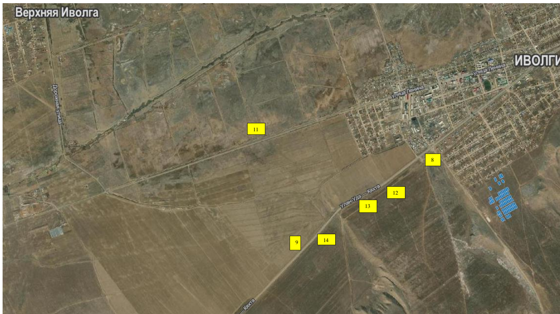
Схема расположения рекламных конструкций на территории МО СП «Иволгинское»