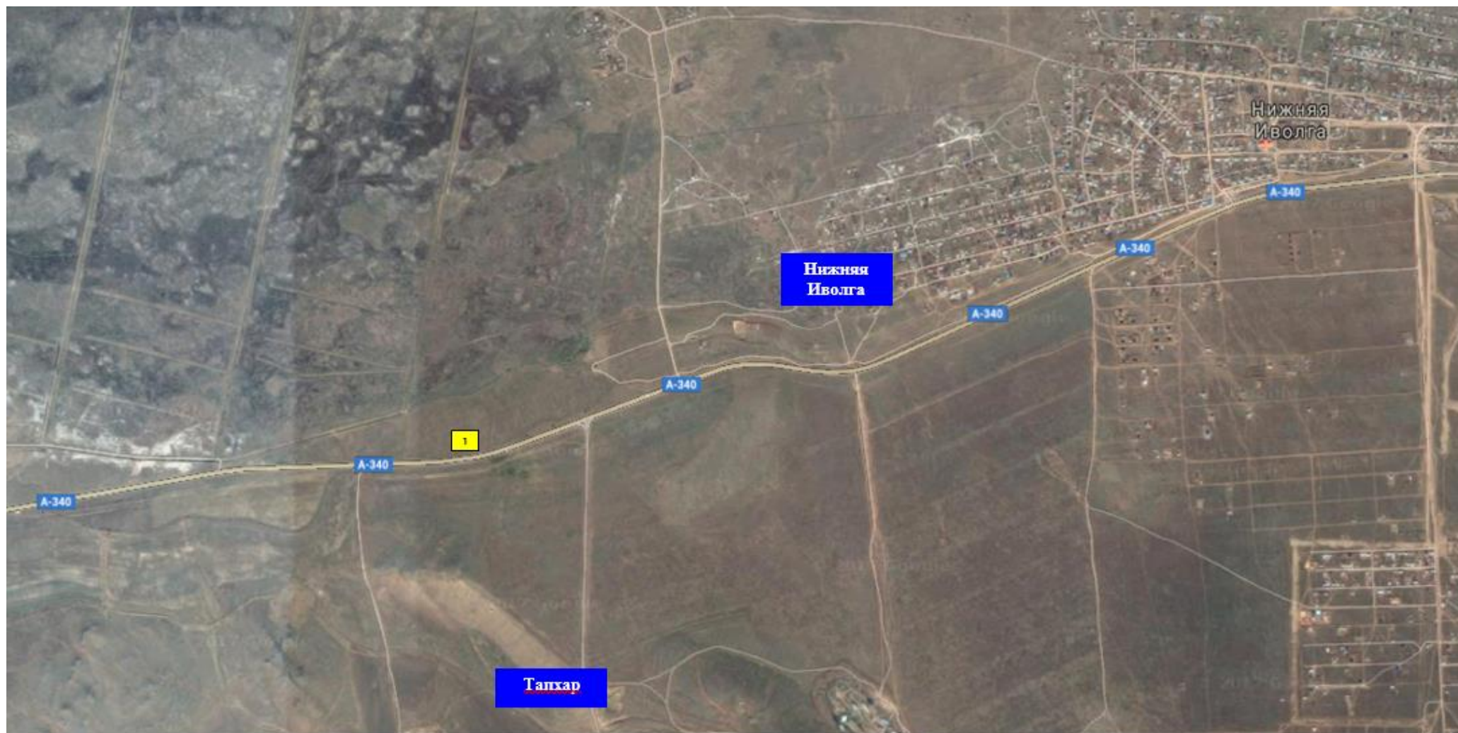
Схема расположения рекламных конструкций на территории МО СП «Иволгинское»