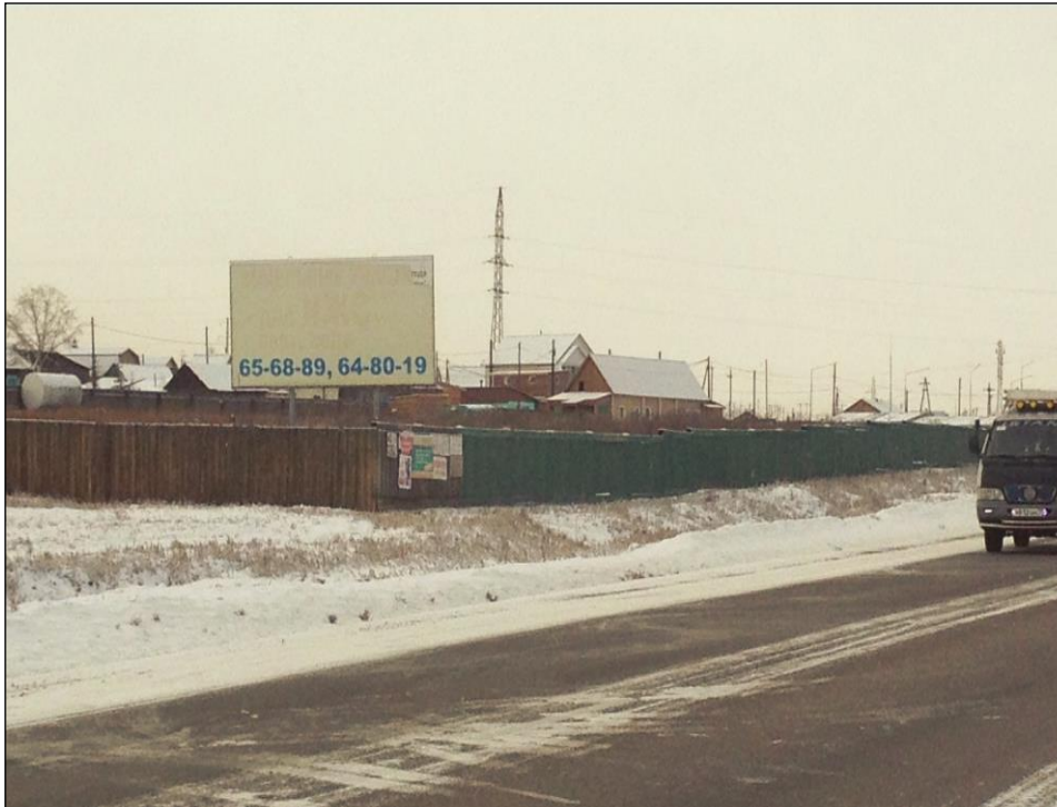
Фотография Сторона А (по ходу движения)