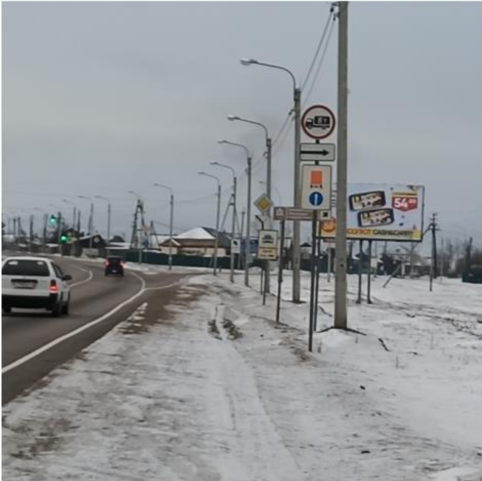
Фотография Сторона А (по ходу движения)