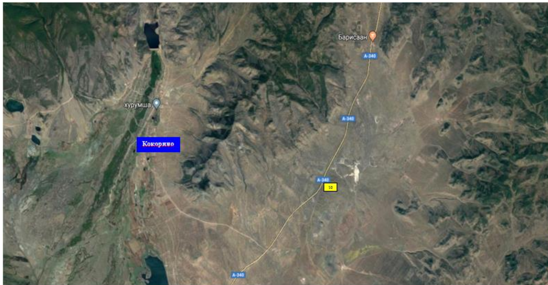
Схема расположения рекламных конструкций на территории МО СП «Иволгинское»