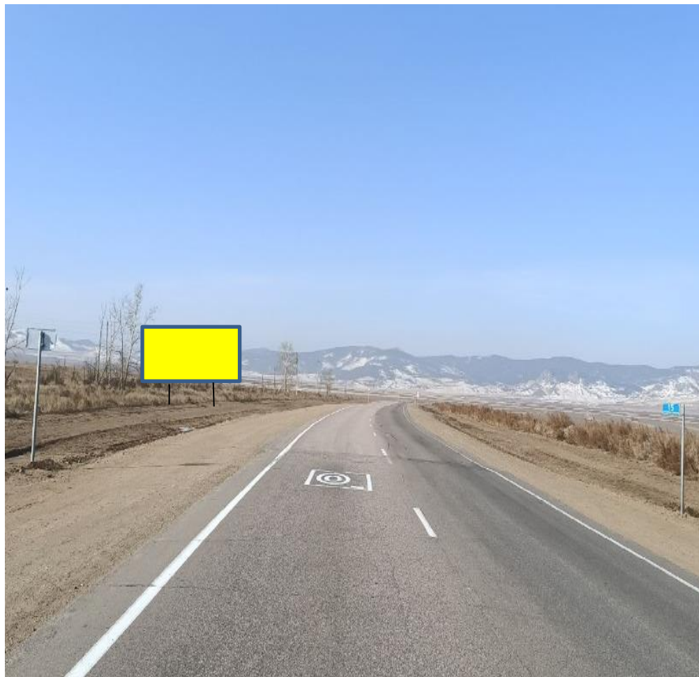
Фотография Сторона А (по ходу движения)