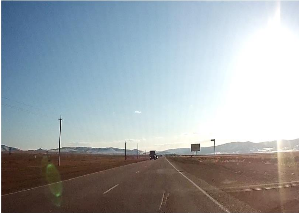
Фотография Сторона А (по ходу движения)