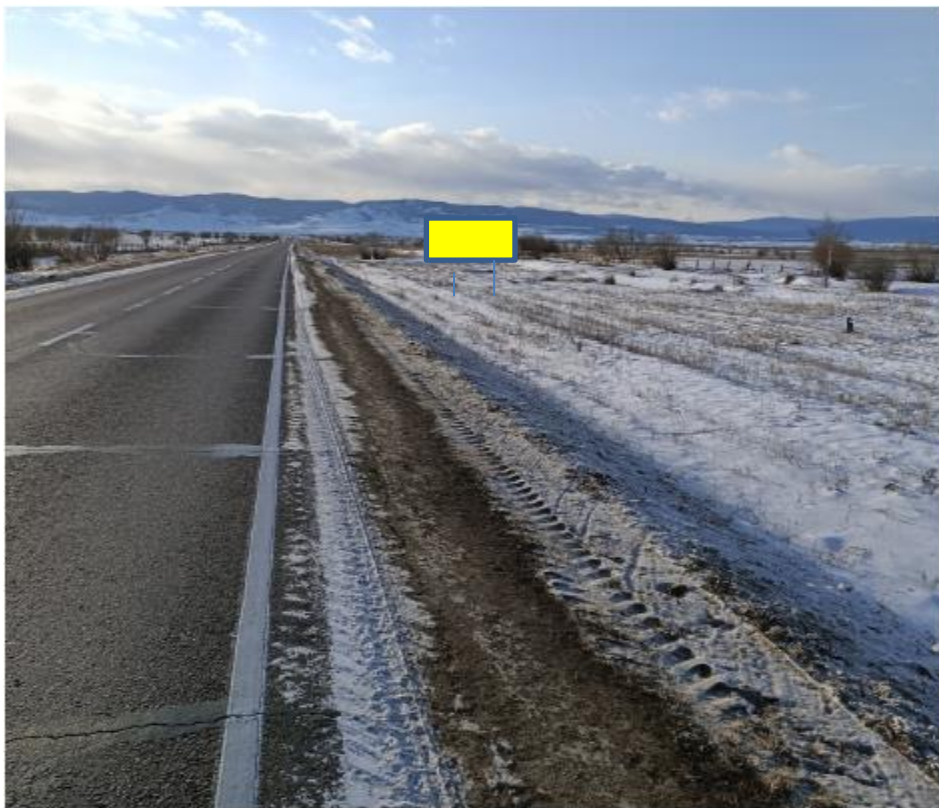
Фотография Сторона А (по ходу движения)