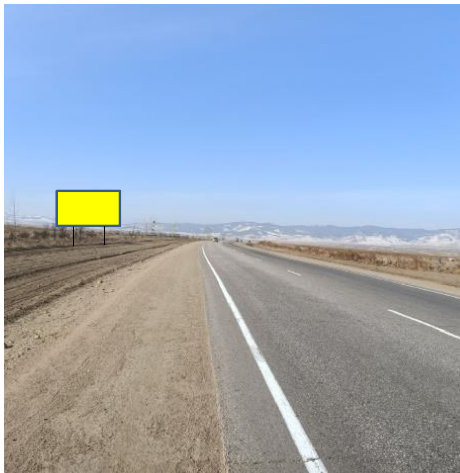
Фотография Сторона А (по ходу движения)