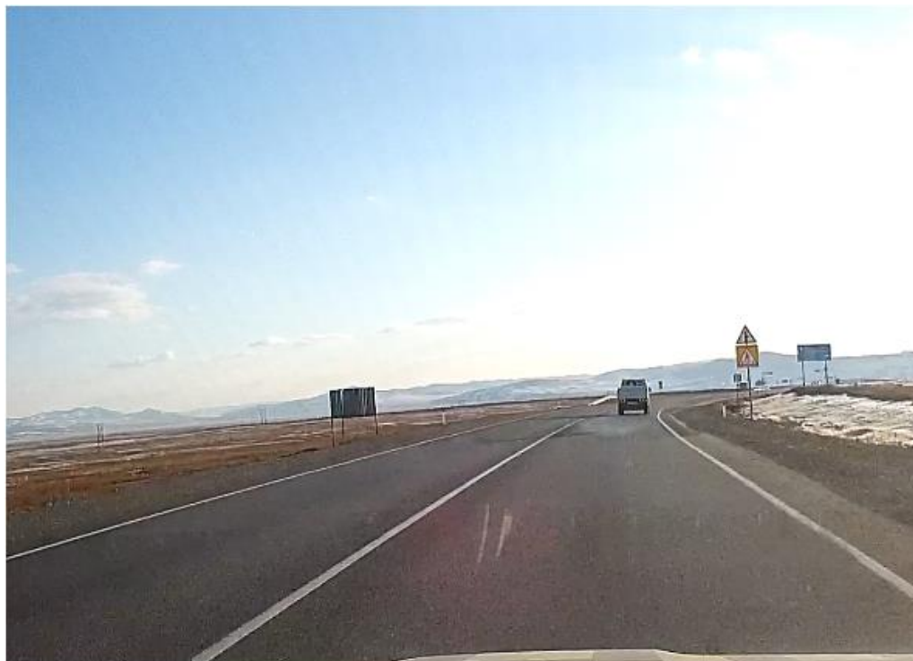
Фотография Сторона А (по ходу движения)