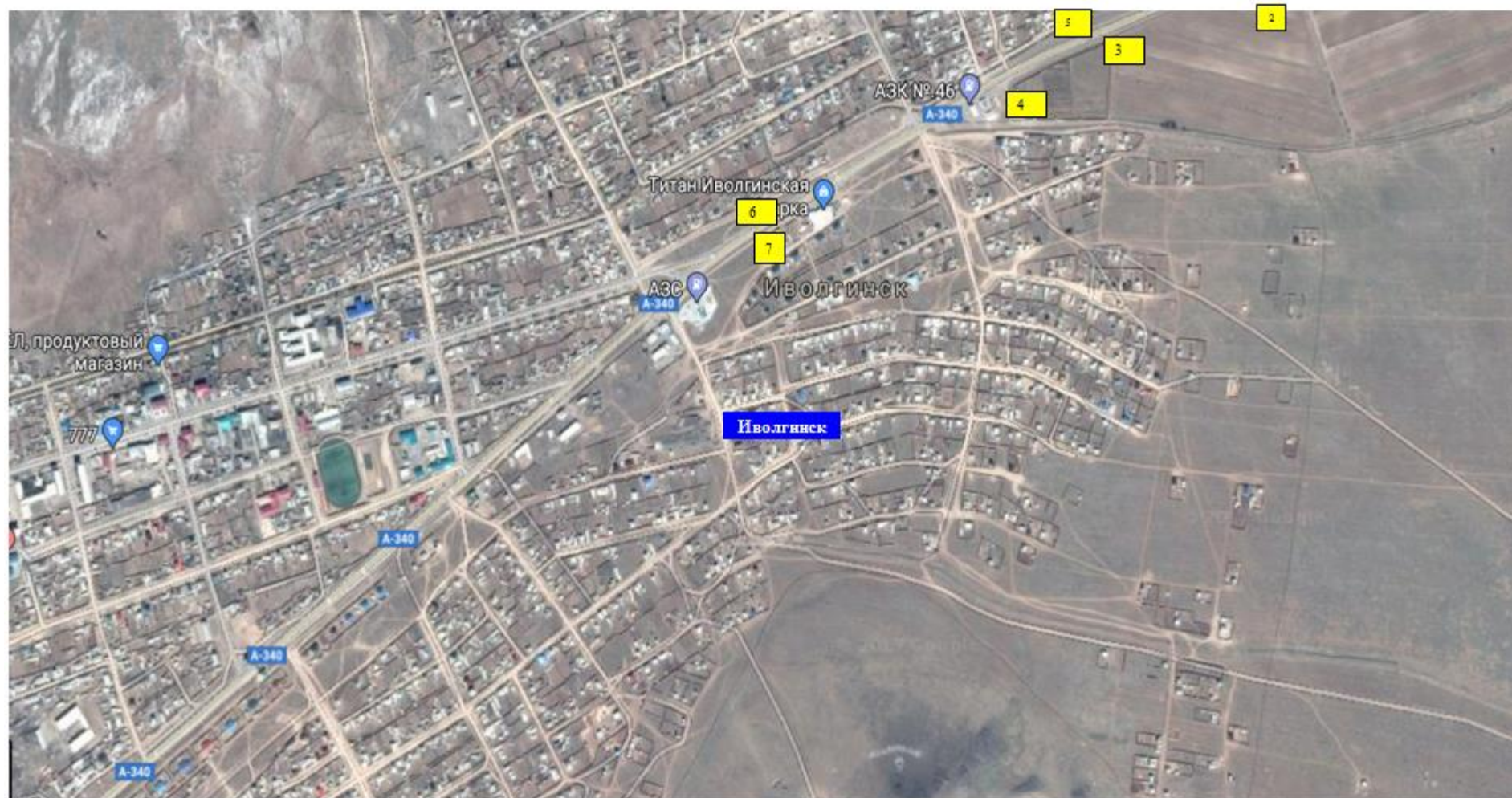
Схема расположения рекламных конструкций на территории МО СП «Иволгинское»