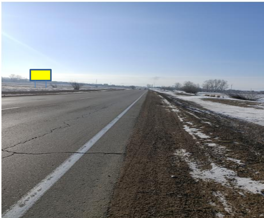
Фотография Сторона А (по ходу движения)